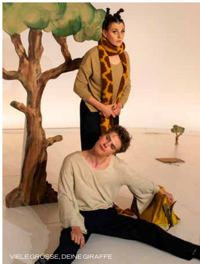
VIELE GRÜSSE, DEINE GIRAFFE